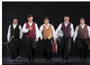
Hot Jazz Revival

Die Blosmaschii ist eine Band aus Löffingen-Unadingen die Jazz, Rock, Pop, Schlager in originelle Bläser Arrangements packt und dann mit Leidenschaft zum Besten gibt. Ihr Leitspruch „Ein Kuss aufs Ohr“ wird immer wieder eindrucksvoll vertont.